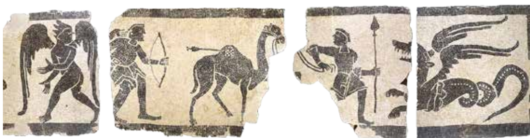
Fig. 2. Frammento di fregio. Resti del mosaico pavimentale proveniente dalla cattedrale romanica di Santa Maria ad Acqui Terme (Museo Civico d'Arte Antica di Palazzo Madama a Torino; per gentile concessione della Fondazione Torino Musei)