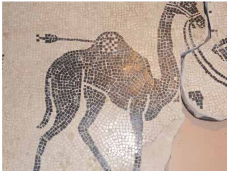
Fig. 3. Particolare dal frammento di fregio. Resti del mosaico pavimentale di Acqui Terme