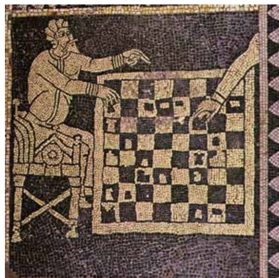
Fig. 4. Particolare dal mosaico pavimentale della basilica romanica di San Savino a Piacenza