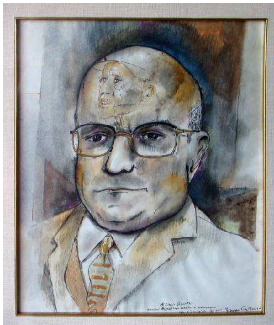
Ritratto di Bruno Caruso