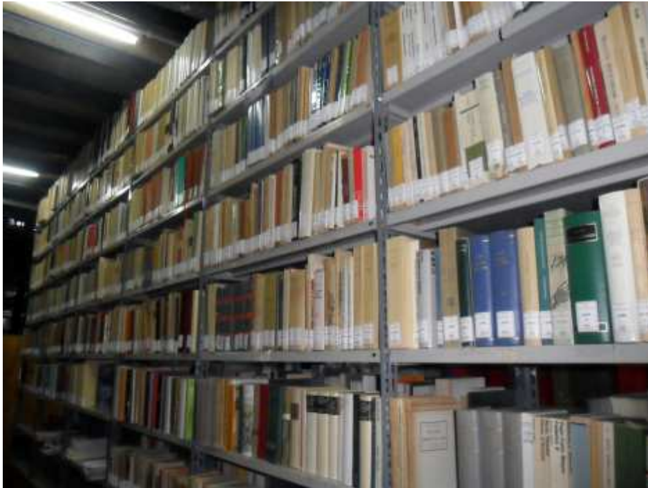
Biblioteca Giunta presso l'Officina di Studi Medievali