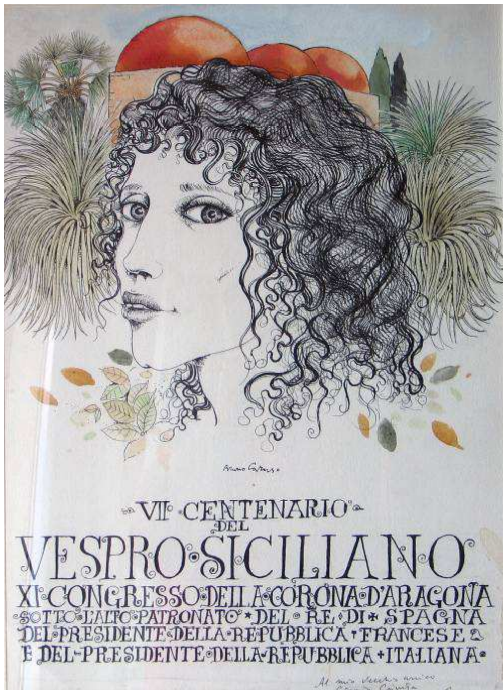
Locandina realizzata per il VII centenario del Vespro Siciliano da Bruno Caruso