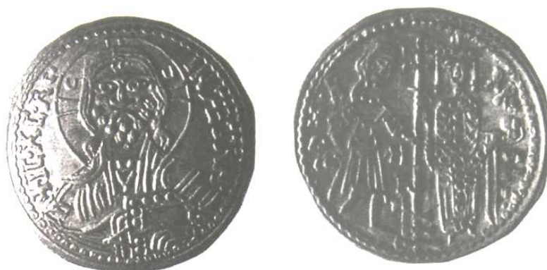
Fig. 2) Ducale di Ruggero II , dritto e rovescio di moneta d'argento, 1140-1154. Napoli, Museo Archeologico Nazionale, Collezione Fiorelli, n. 444.