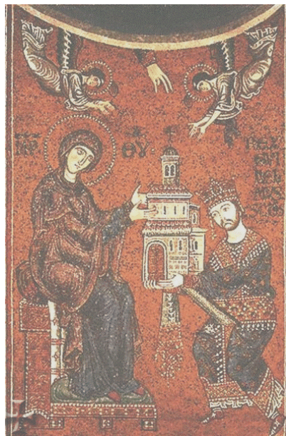
Fig. 4) Guglielmo II offre la Basilica alla Vergine , mosaico, 1180-1189 circa. Monreale, cattedrale, presbiterio.