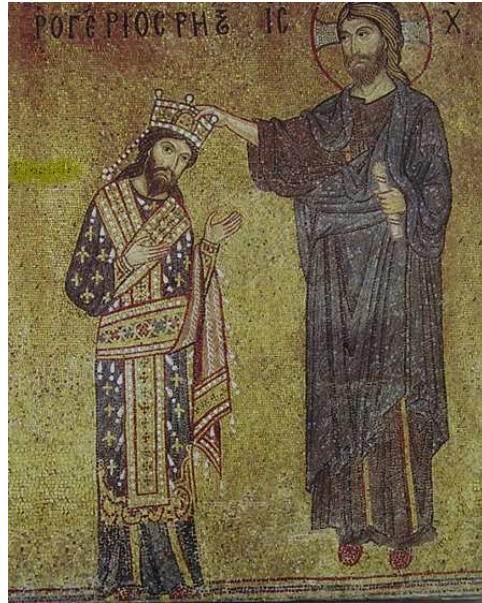
Fig. 7) Ruggero II incoronato da Cristo , mosaico, 1146-1151 circa. Palermo, chiesa di Santa Maria dell' Ammiraglio (detta della Martorana), interno.