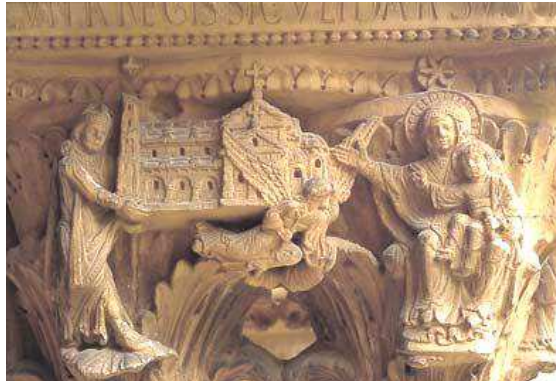
Fig. 5) Guglielmo II offre la Basilica alla Vergine , dettaglio di un capitello, scultura, 1180-1189 circa. Monreale, cattedrale, chiostro.