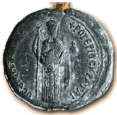
Fig. 1 - Bolla di Ruggero II re , rovescio di impronta su piombo, 3 novembre 1144. D RO. II 66. Ariano Irpino, Collezione privata.