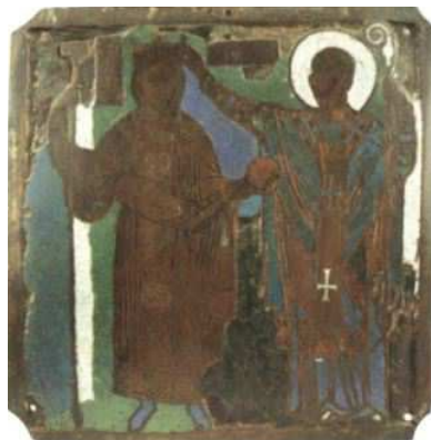
Fig. 6) Ruggero II è benedetto da San Nicola , piatto in smalto, post 1139. Bari, Museo della Basilica di San Nicola.