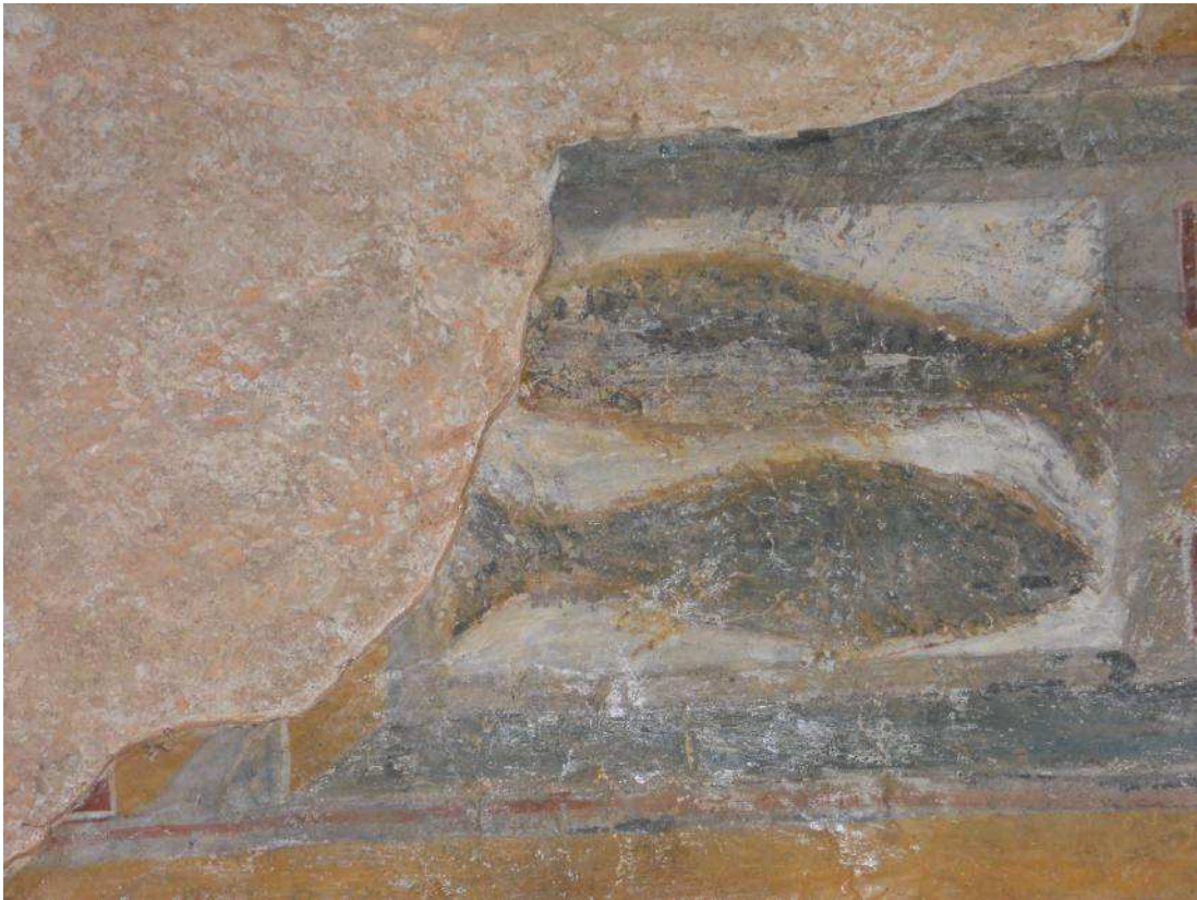
Fig. 9. Cappella romanica di San Ferreolo a Grosso Canavese (TO). Pesci.