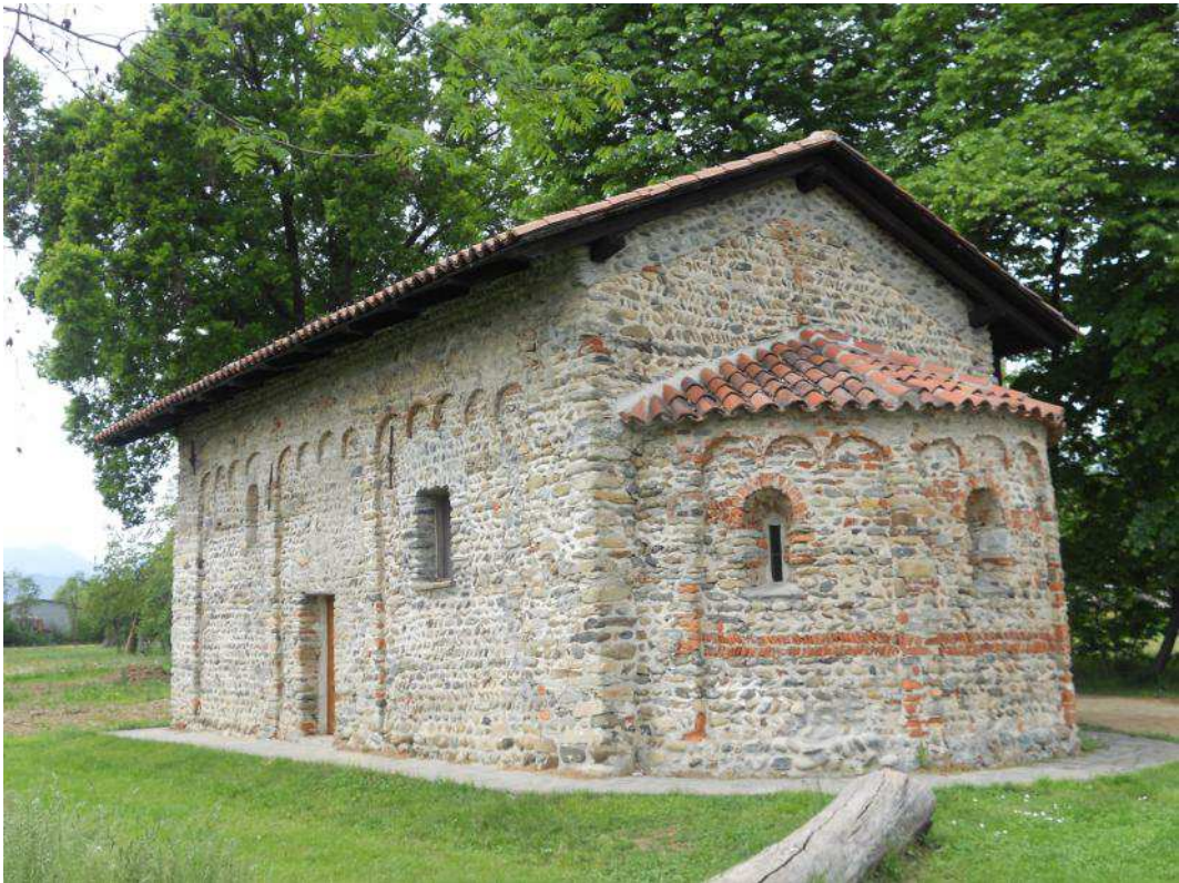
Fig. 2. Cappella romanica di San Ferreolo a Grosso Canavese (TO). Vista laterale con abside.