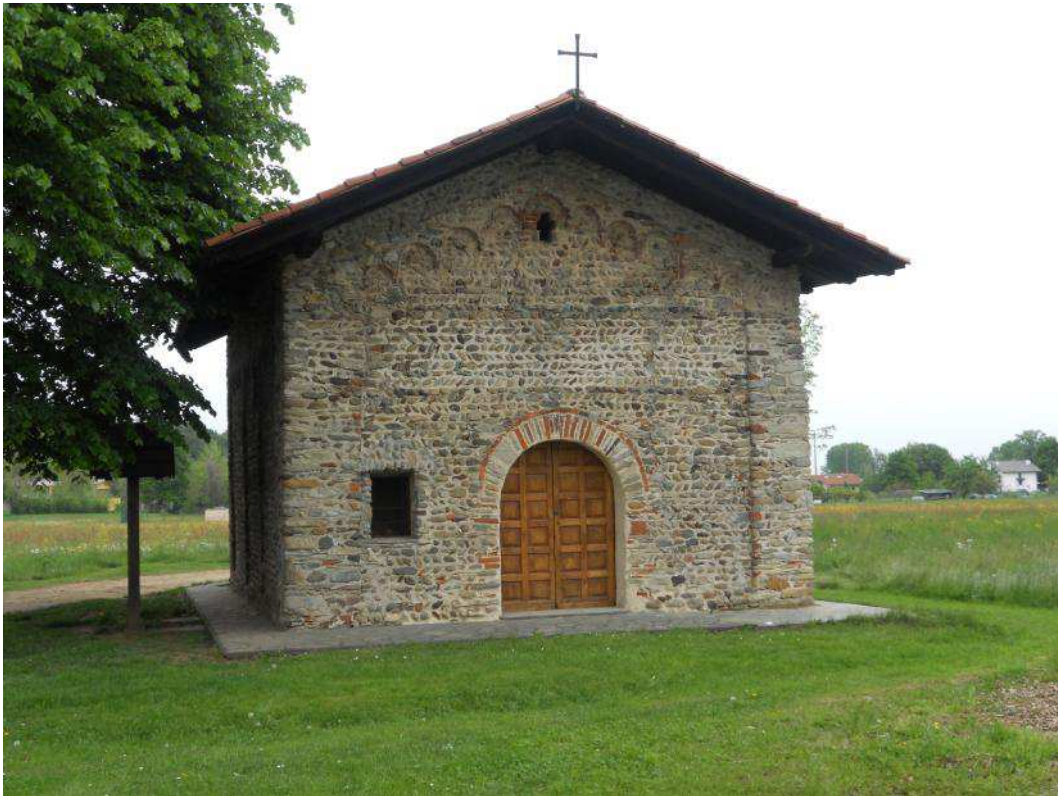
Fig. 1. Cappella romanica di San Ferreolo a Grosso Canavese (TO). Vista frontale.

* Le foto sono dell'autore. Si ringrazia per l'assistenza l'arch. Oscar Rossi e il dr. Marco Rivalta.