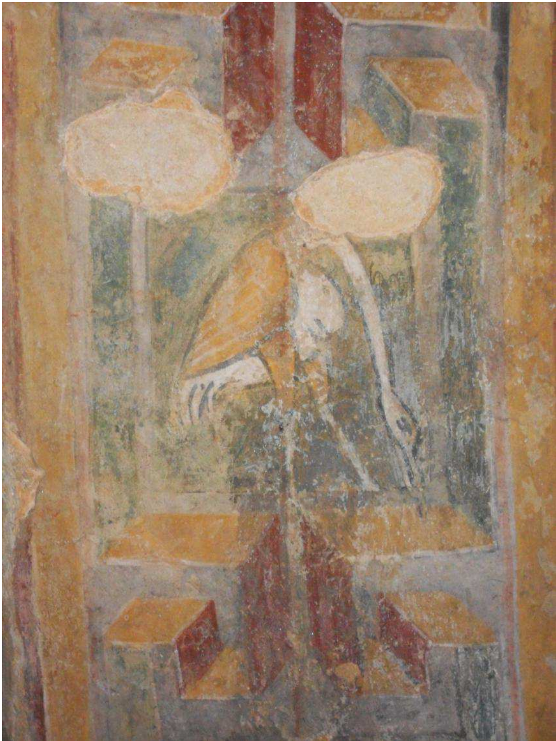
Fig. 8. Cappella romanica di San Ferreolo a Grosso Canavese (TO). Airone.