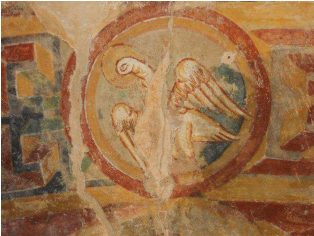
Fig. 6. Cappella romanica di San Ferreolo a Grosso Canavese (TO). Cigno.