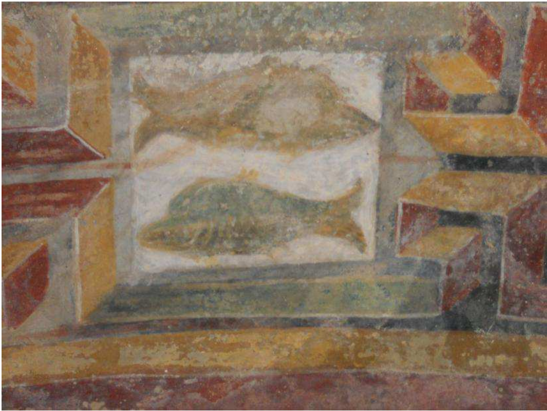
Fig. 7. Cappella romanica di San Ferreolo a Grosso Canavese (TO). Pesci.