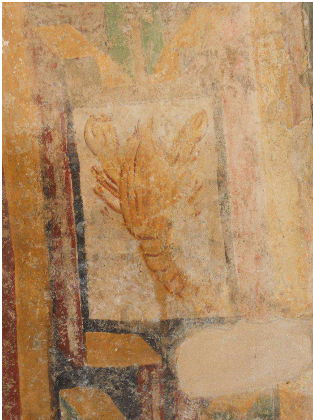
Fig. 3. Cappella romanica di San Ferreolo a Grosso Canavese (TO). Scorpione.