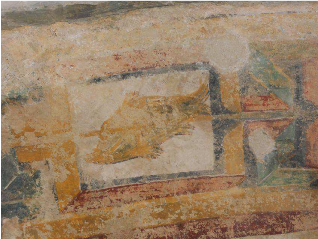
Fig. 5. Cappella romanica di San Ferreolo a Grosso Canavese (TO). Pesce australe.