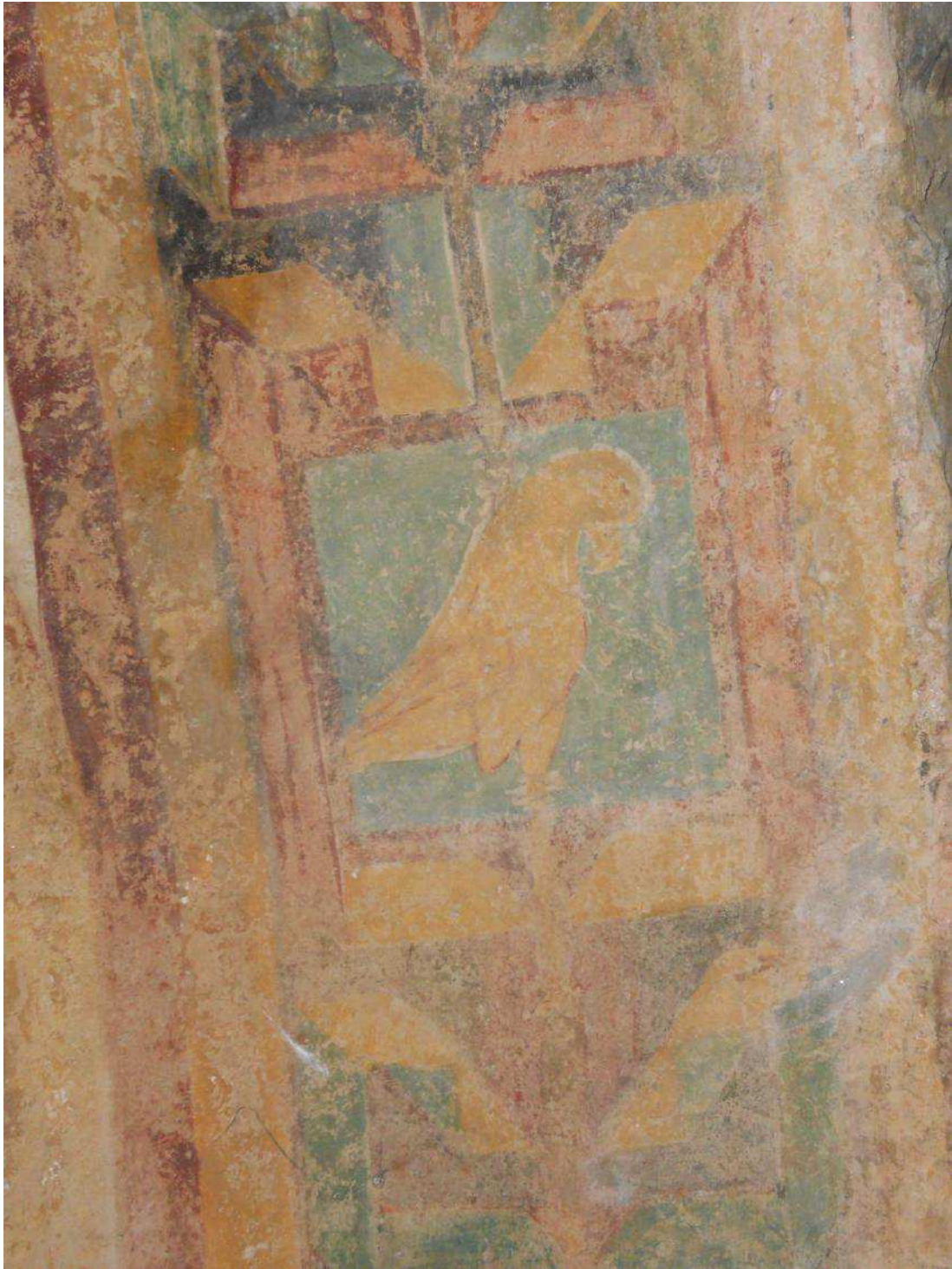
Fig. 4. Cappella romanica di San Ferreolo a Grosso Canavese (TO). Colomba.